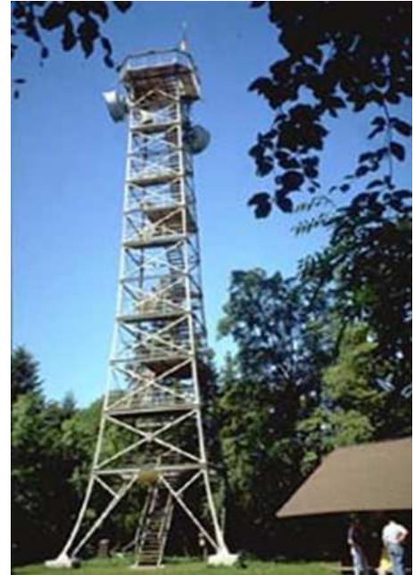
Hängebrücke Oberhohenberg und Lembergturn

Über eine rege Teilnahme würde ich mich freuen. Eine Anzahlung ist nicht erforderlich. Jeder bezahlt selber. Trotzdem würde ich mich über eine Anmeldung freuen, damit ich entsprechend planen kann.