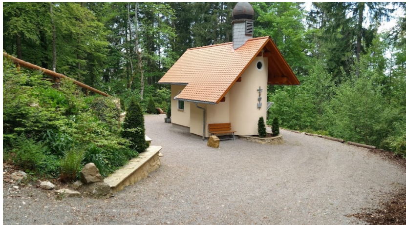
Nikolauskapelle bei Schörzingen

Rahmendaten: Wanderstrecke ca. 12,0 km Wanderzeit ca. 4 Stunden zzgl. Vesperpause Höhendifferenz ca. 580 m Aufstieg und Abstieg