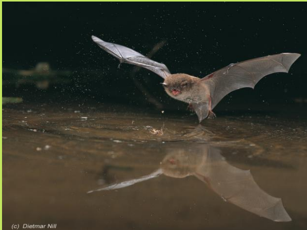
Braunes Langohr ( Plecotus auritus )