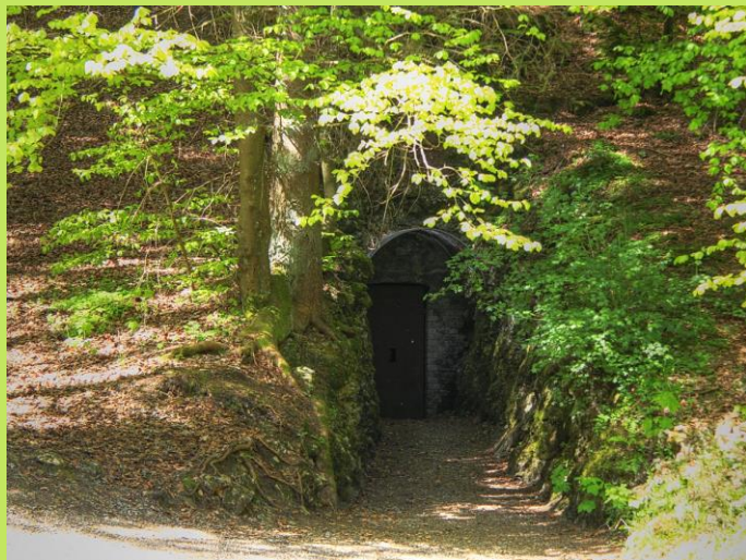
Eingang der Linkenboldshöhle (906 m N.N.) Koordinaten: N48° 16' 34.0" - E9° 01' 50.8"

Der schlichte Eingang lässt nicht vermuten, dass sich dahinter eine solch faszinierende Tropfsteinhöhle befindet, wie sie für die Schwäbische Alb typisch ist. Ursprünglich war der Zugang nur über ein natürliches Schachtloch möglich. Im Jahr 1876 wurde mit einem Stollen ein bequemer Eingang geschaffen und seit 1975 ist die Höhle mit elektrischer Beleuchtung versehen.